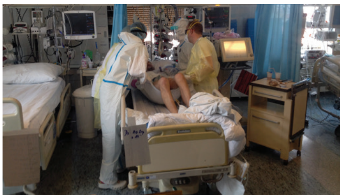
Obrázek 1 | Polohování pacienta s těžkým průběhem, typická dobrovolnická práce

Studenti adiktologie ze všech ročníků bakalářského i navazujícího magisterského stupně se v průběhu března a dubna 2021 aktivně zapojili jako dobrovolníci do chodu akutně zřízených oddělení pro pacienty s onemocněním COVID-19 v rámci Všeobecné fakultní nemocnice v Praze. Celkem 16 studentů a studentek působilo při dnešních i nočních směnách na odděleních II. interní kliniky a I. chirurgické kliniky 1. LF UK a VFN v Praze, další tři studentky vypomáhaly v rámci mateřské školy pro děti zdravotníků-zaměstnanců VFN, respektive zapojily se do procesu organizace očkování proti nemoci COVID-19 při Klinice nefrologie.