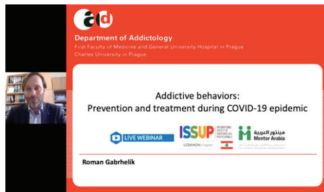
Obrázek 3 | Doc. Gabrhelík s úvodním slidem svého webináře

Doc. Roman Gabrhelík promluvil o prevenci a léčbě závislostního chování během epidemie COVID-19. Ve webináři se dozvíte, které cílové skupiny mohly být danými restrikcemi pandemie COVID-19 postiženy, jaké typy rizikového chování by měly vyžadovat pozornost odborníků na závislosti, a kroky, které by měly být podniknuty a zaměřeny na výše zmíněné cílové skupiny (obrázek 3).