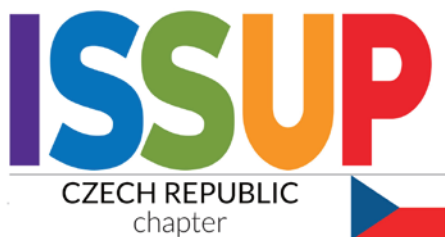
Obrázek 6 | Logo ISSUP Czech Republic

Jak jednoduše nepromeškat další z přednášek (nejen) našich profesionálů z adiktologie? Na webových stránkách www.issup.net se lze jednoduše přihlásit ke členství, jež je bezplatné. Velkým benefitem členství je přístup k publikacím z celého světa, záznamům z konferencí či tematickým online webinářům. Člen však neplní pouze pasivní roli, může se aktivně zapojovat do diskuzí, sdílet své publikace nebo uspořádat webinář na odborné téma a reprezentovat tím naši zemi, naši národní kapitolu (obrázek 6).