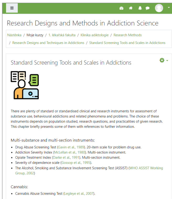
Obrázek 2 | Ukázka výukové lekce předmětu v Moodle

Výzkum v adiktologii je multidisciplinární povahy a jako takový pokrývá širokou škálu oborů. Totéž platí pro metody a nástroje ve výzkumu závislostí. Mnohé výzkumné designy, metody a techniky vycházejí z jiných oborů, jako je epidemiologie, sociologie, psychologie, behaviorální ekonomie, klinický výzkum, zatímco některé byly přímo vyvinuty pro výzkum v adiktologii nebo je jejich aplikace v adiktologickém výzkumu typická. Tento předmět nabízí studentům základní přehled nejpoužívanějších designů