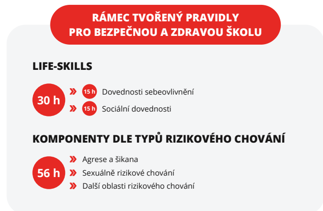
Obrázek 1 | Schéma preventivních témat a life-skills jako základů pro preventivní působení

Preventivní působení nestojí pouze na externě dodávaných programech, ale úzce souvisí s nastavením školy. Metodika proto zahrnuje také témata související s řízením kvality, budováním kapacit a s podporou příznivého organizačního klimatu ve škole či školském zařízení. Jsou v ní uvedeny jednoduché, univerzálně aplikovatelné principy TQM (Total Quality Management) modelu a principy kontinuálního rozvoje na základě plánování, implementace a evaluace zaváděných změn. (Obrázek 3.)